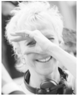
TONIE MARSHALL (Scénariste, réalisatrice)