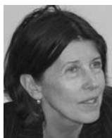
MONIQUE DAGNAUD (Sociologue)

Auteur Réalisateur de La Cible long métrage sorti en 1997 et récompensé au Festival de Sarlat. En 2003 il signe le scénario du long métrage Livraison à Domicile , film réalisé par Bruno Delahaye. Actuellement en casting, Pierre Courrège prépare La Face cachée de la Pomme (tournage au printemps 2009). Il a également co-écrit le scénario de Mer Calme, Mort Agitée , téléfilm réalisé par Charles Némès. Actuellement sous contrat chez Endemol Fiction pour une série policière : Face à Face .