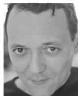
ARSÈNE MOSCA (Comédien, scénariste)

Ancien professeur d'anglais, il connaît son premier succès en tant que scénariste en 1994, quand la BBC accepte de produire le pilote de People like us , WGA de la meilleure comédie radiophonique. Un peu plus tard, il crée avec Chris Langham la sitcom Kiss me Kate pour BBC1. En 1999, il crée The Sunday Format , une nouvelle série à succès pour la radio. Au même moment, il se lance dans l'adaptation TV de People like us qu'il écrit et réalise pour BBC2. La série est récompensée par de nombreux prix dont la rose d'argent du Festival de Montreux. En 2003, il réalise les 6 épisodes de Absolute Power , satire sur le milieu des relations publiques avec Stephen Fry et John Bird. Il travaille poursuit en tant que directeur littéraire pour la série Help , puis il écrit et réalise avec Tony Roche la série Broken News , comédie sur les coulisses d'une chaîne d'information 24/24.